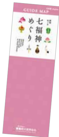
新宿山ノ手七福神めぐりマップ